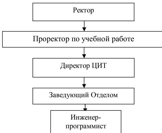
Схема организационной структуры Отдела программного обеспечения