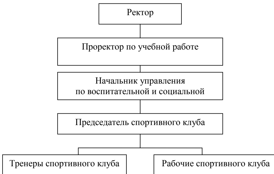
Схема организационной структуры спортивного клуба